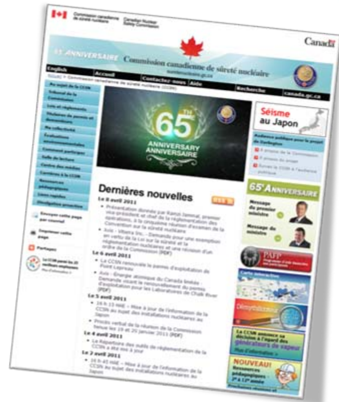
Visitez notre site Web au suretenucleaire.gc.ca