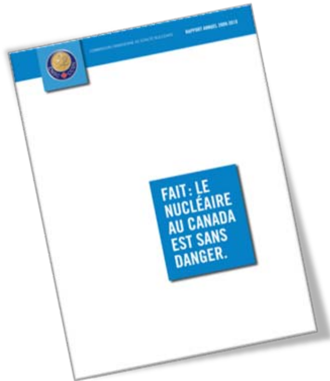
Rapport annuel 2009-2010