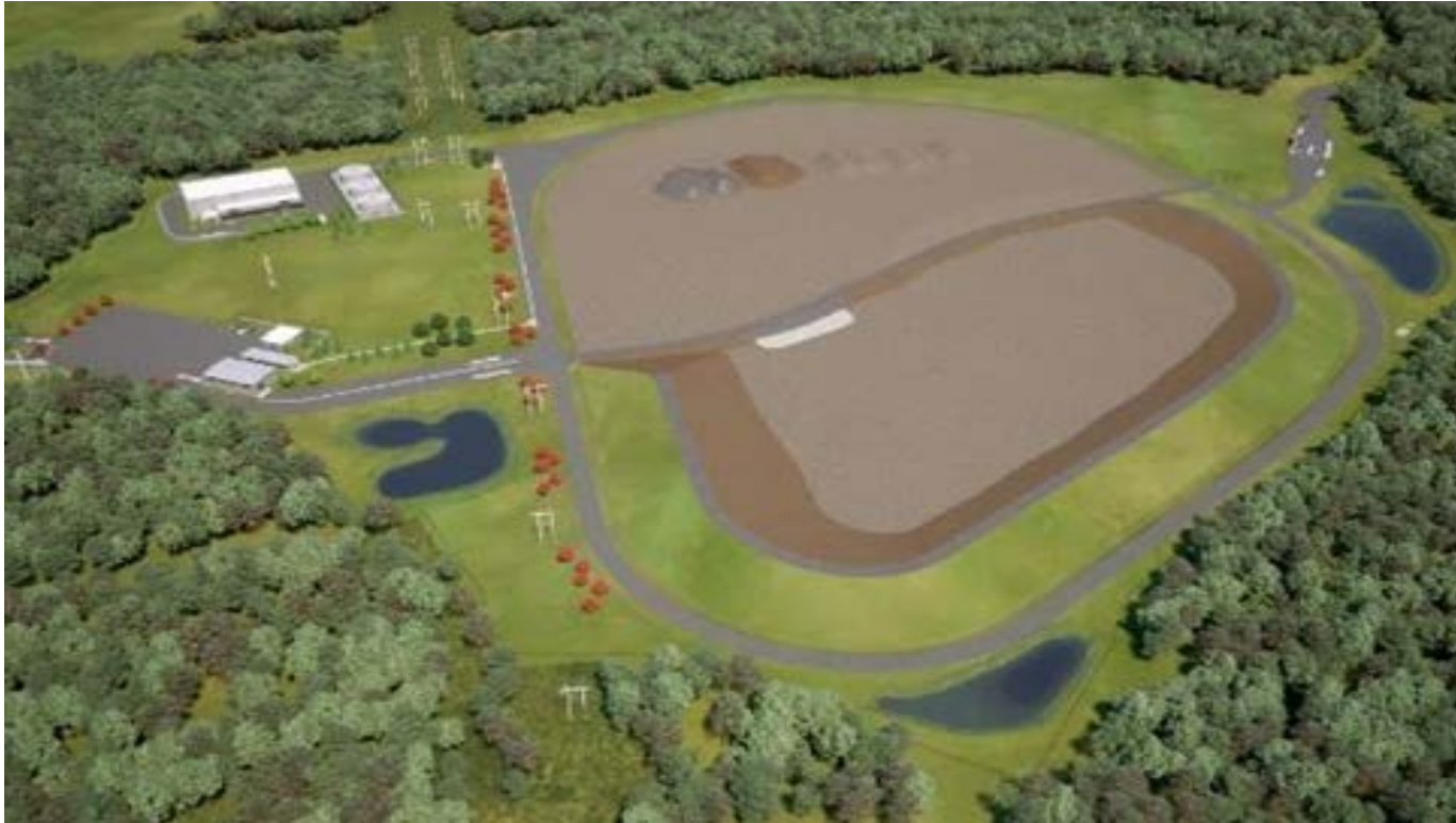
Proposition d'installation de gestion des déchets près de la surface (IGDPS), Laboratoires de Chalk River